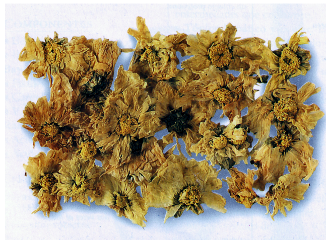
Cabezas florales secas